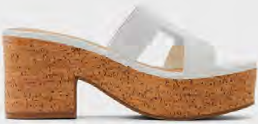
صندل هاليريا بكعب بلاتوه AED 299