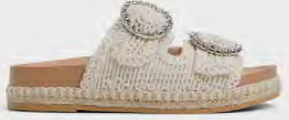
صندل بلاتوه جوني بسبور كروشييه AED 329