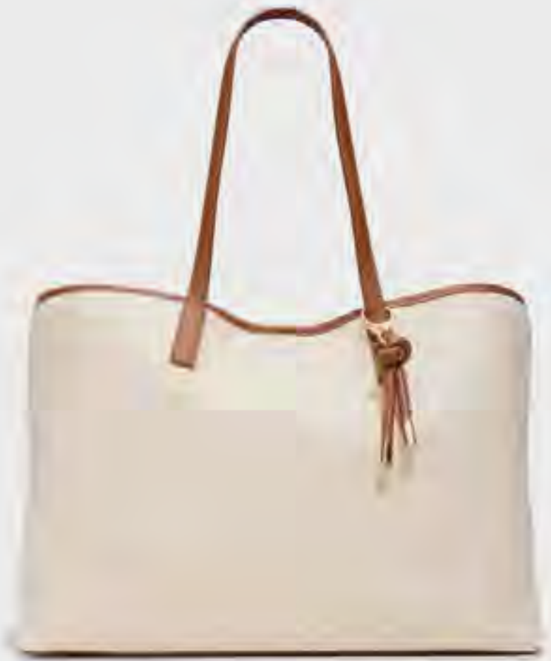
شنطة تيت لوك آوت بارزة الملمس AED 279