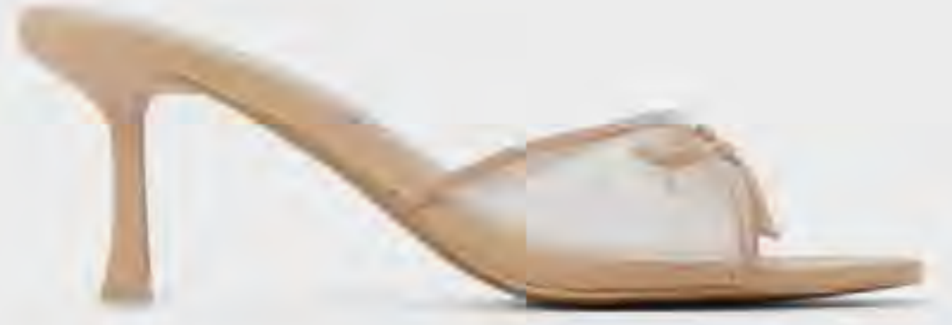
صندل بيتي بكعب وتفاصيل فيونكة AED 249