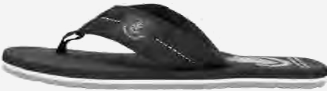
شبشب بحر بطبعة شعار AED 250