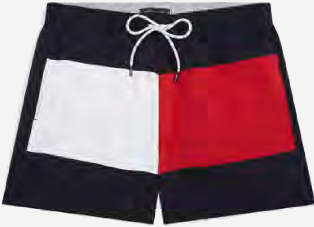
شورت سباحة لونين برباط AED 400