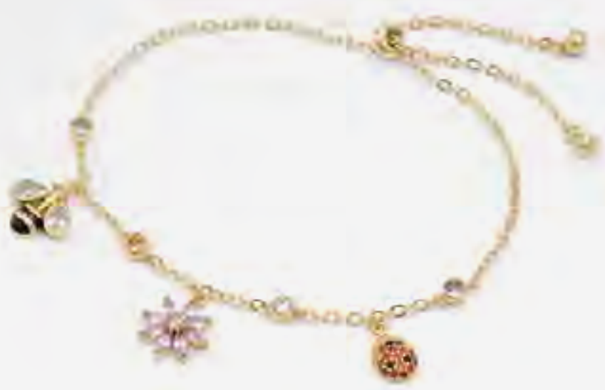
سوار بلوميت ذهبي مع دلايات AED 129