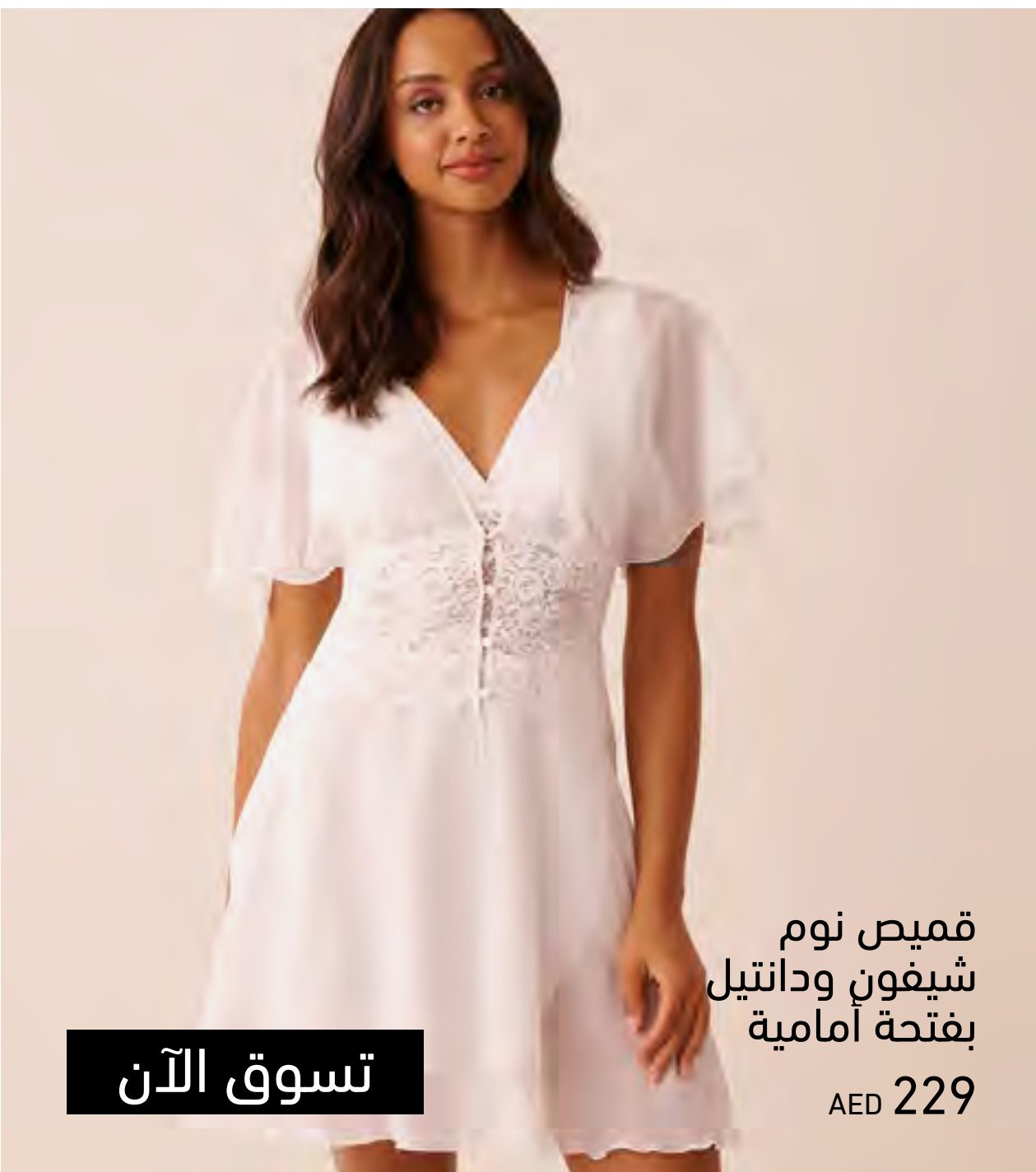
قميص نوم شيفون ودانتيل بفتحة أمامية AED 229