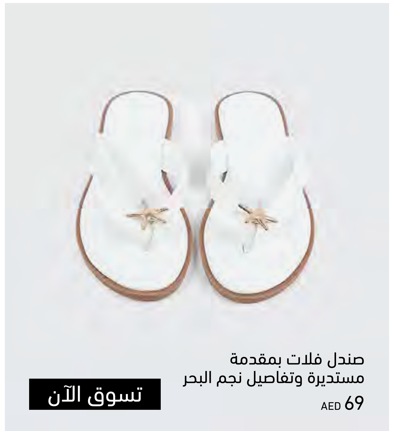
صندل فلات بمقدمة مستديرة وتفاصيل نجم البحر AED 69