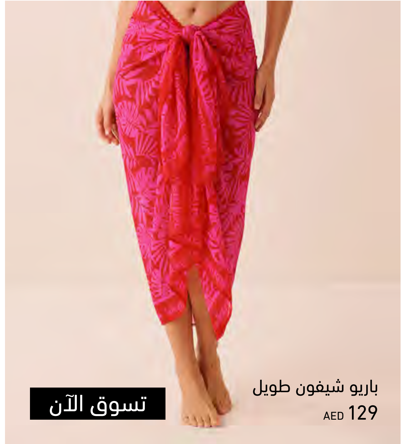
باريو شيفون طويل AED 129