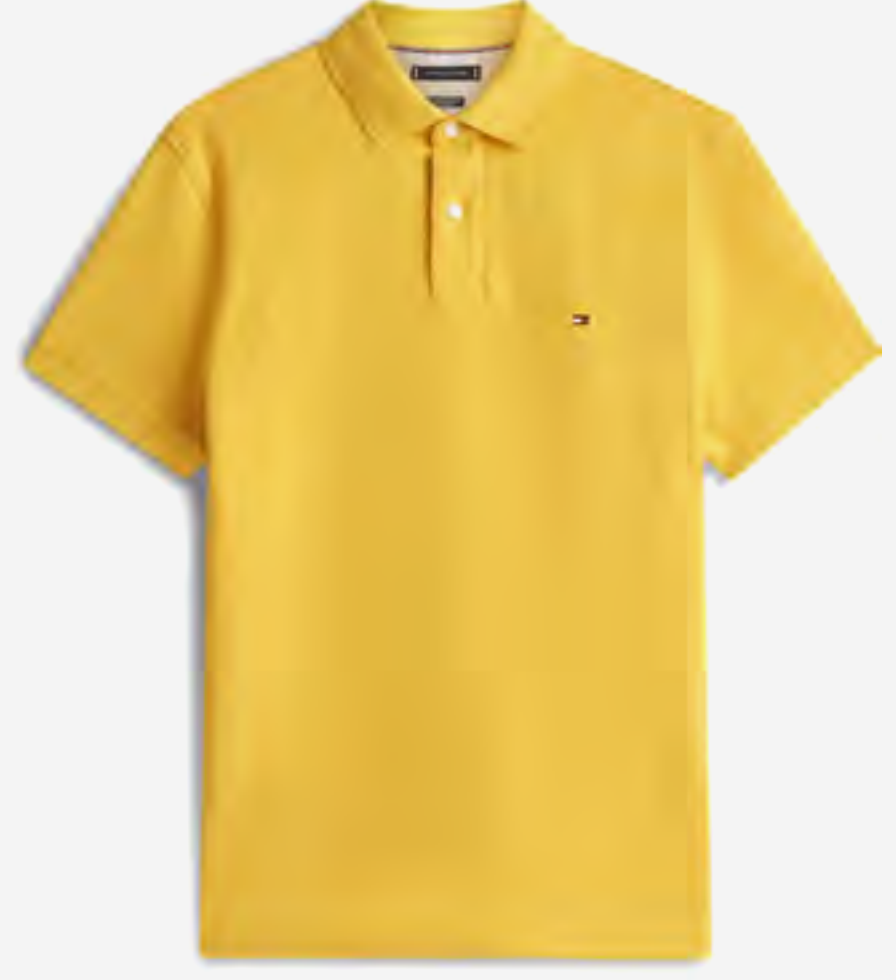
تيشيرت بولو ضيق مطرز بعلم AED 420