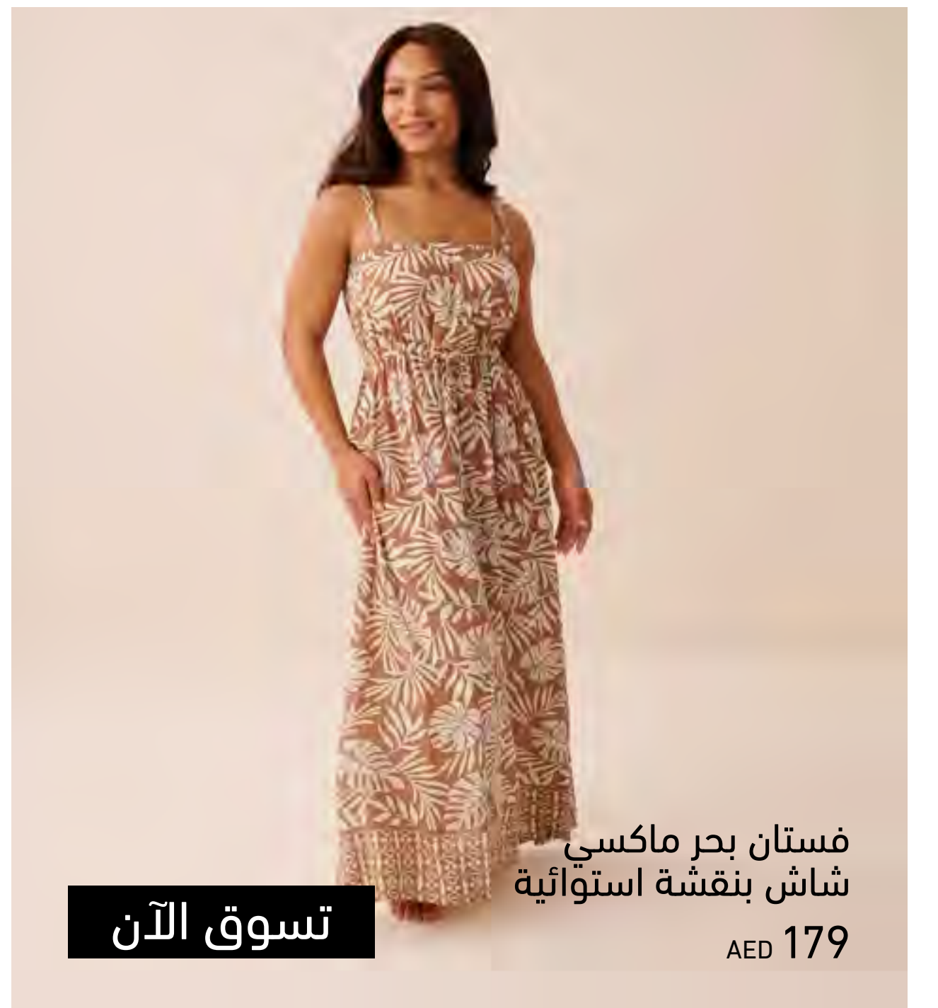
فستان بحر ماكسي شاش بنقشة استوائية AED 179