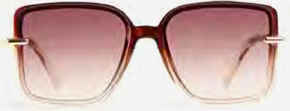
نظارة شمسية مايا كبيرة الحجم بلون متدرج AED 99