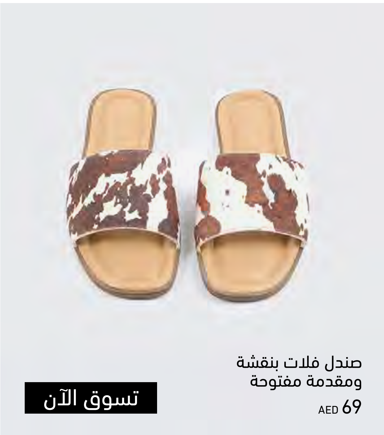
صندل فلات بنقشة ومقدمة مفتوحة AED 69