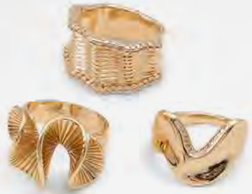
طقم خواتم كابكي ذهبية AED 99