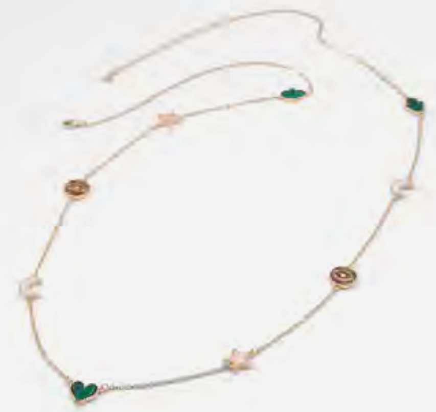
قلادة سولينلا ذهبية AED 129