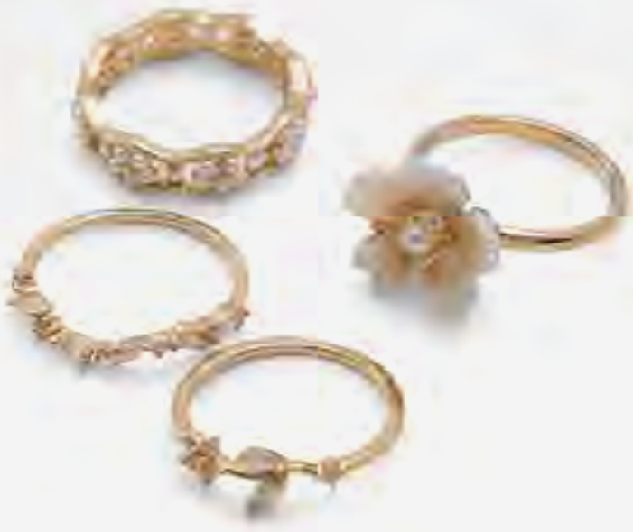
طقم خواتم أليكسيا مزينة AED 129