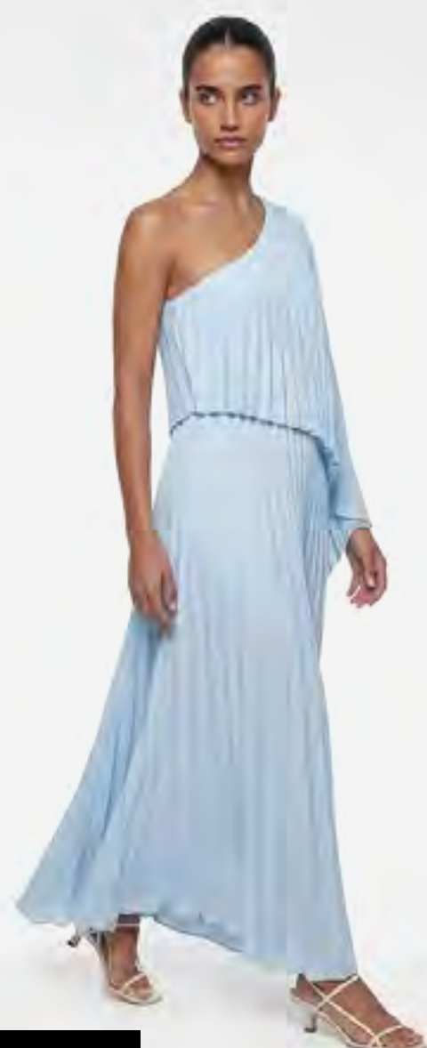
فستان ميدي بكسات وكتف واحد AED 599