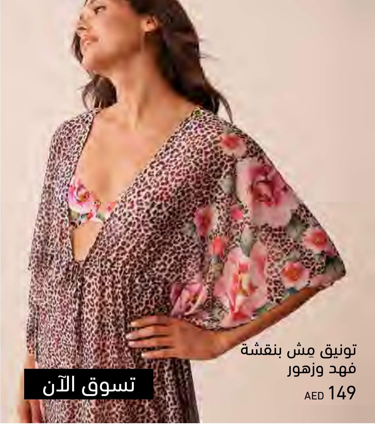
تونيق مش بنقشة فهد وزهور AED 149