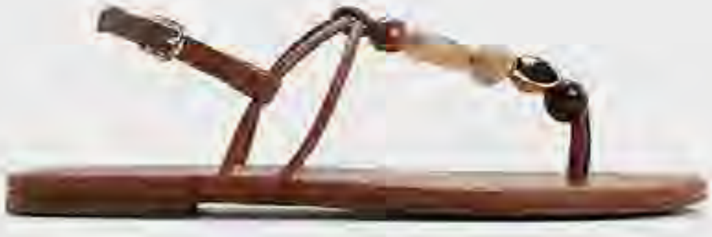
صندل توباز فلات بسير إصبع وتفاصيل أحجار AED 279