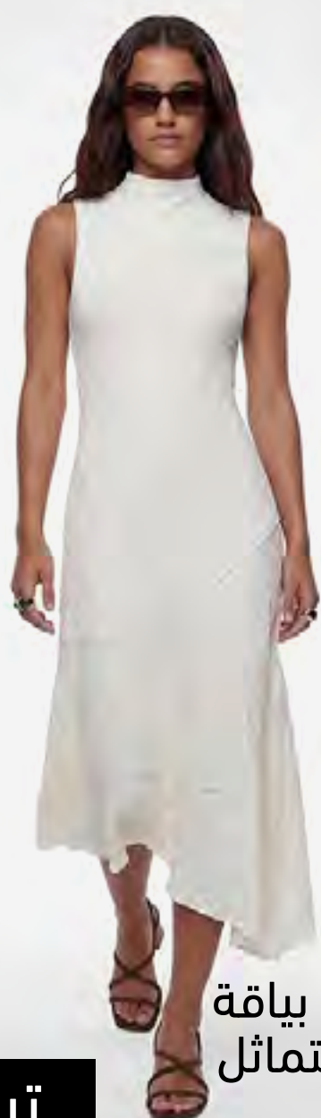
فستان ميدي دانتييل بياقة عالية وتصميم غير متماثل AED 279