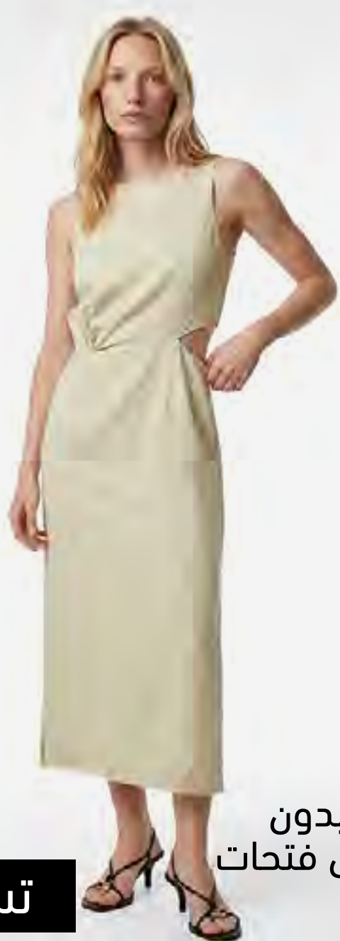
فستان ميدي بدون أكمام وتفاصيل فتحات AED 179