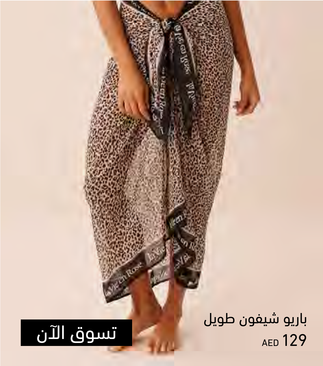
باريو شيفون طويل AED 129