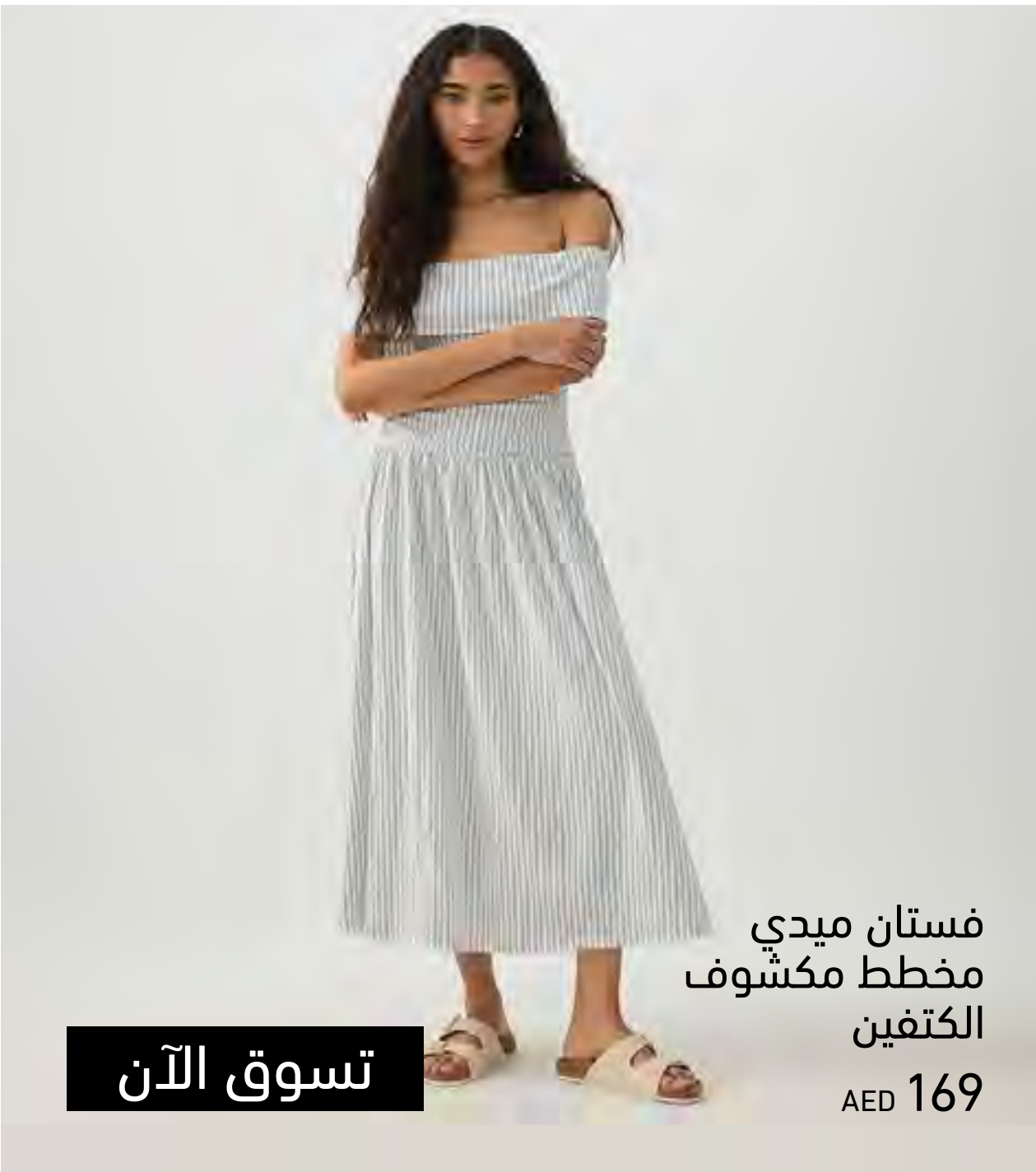
فستان ميدي مخطط مكشوف الكتفين AED 169