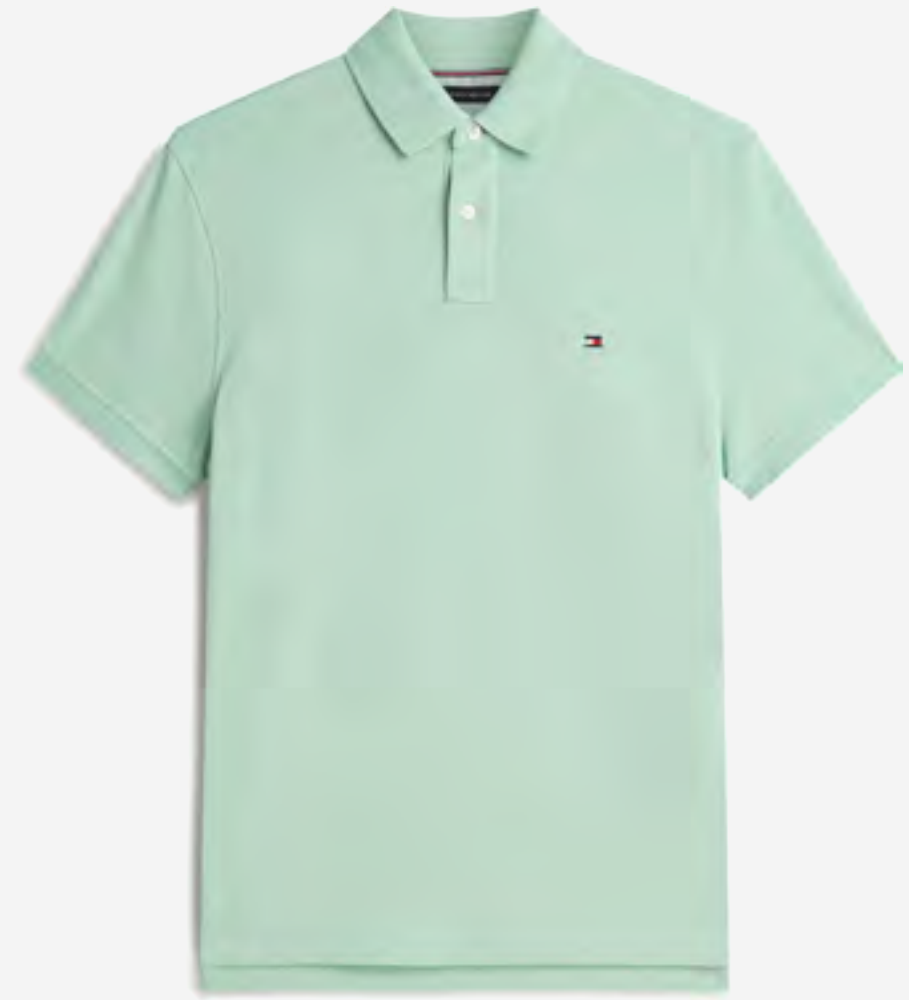
تيشيرت بولو 1985 بكم قصير AED 420