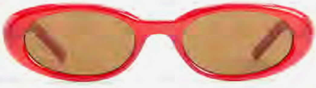
نظارة شمسية أميليا سادة بتصميم ريترو AED 79