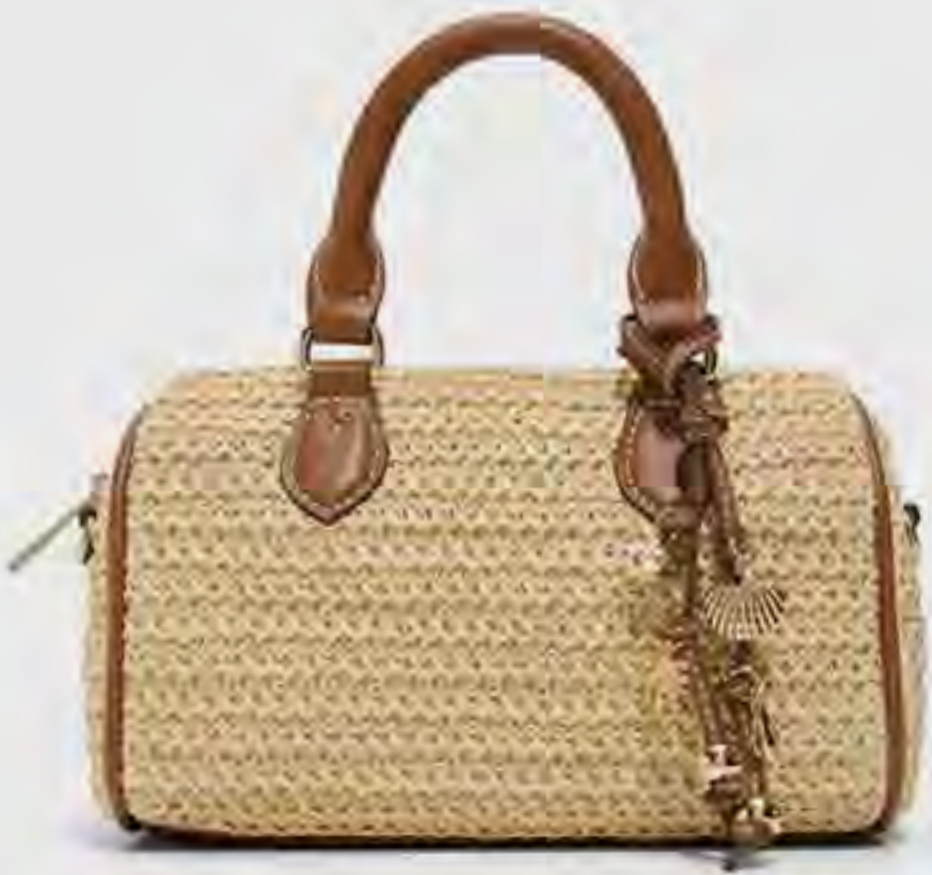
شنطة ساتشيل تانا من الرافيا AED 279