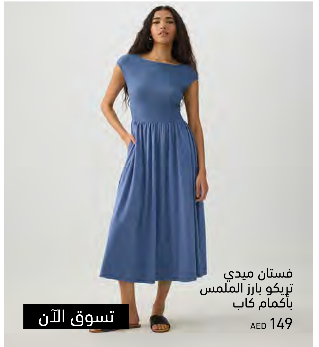
فستان ميدي تريكو بارز الملمس بأكمام كاب AED 149