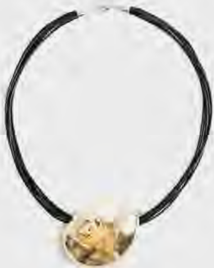
قلادة بتفاصيل صدف البحر AED 99