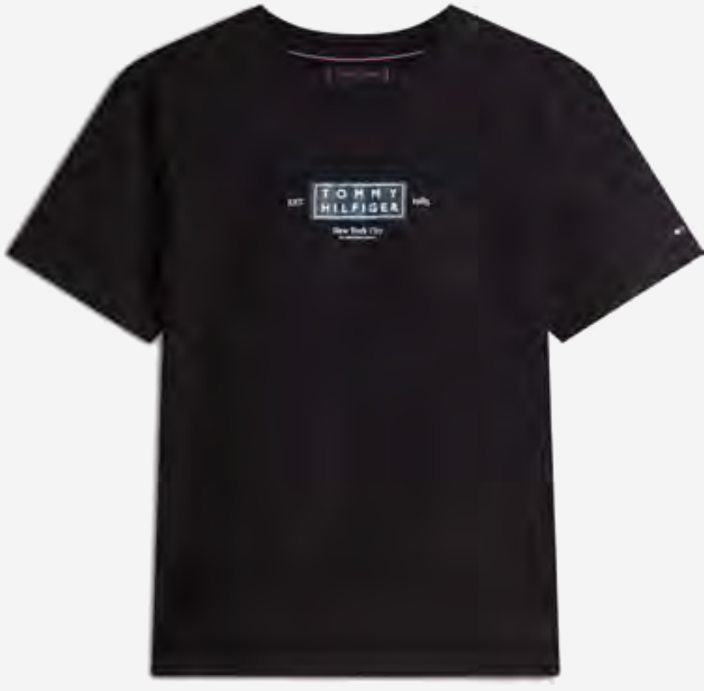
تيشيرت بأكمام قصيرة بطبعة شعار AED 300