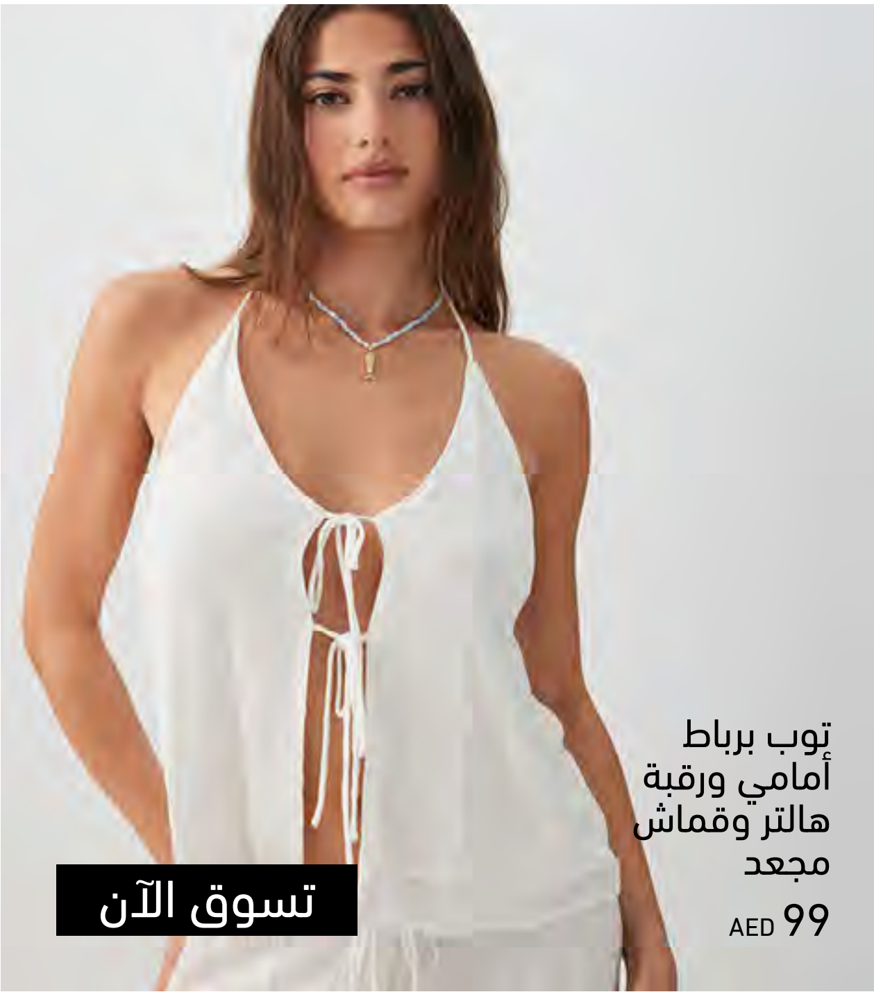
توب برباط أمامي ورقبة هالتر وقماش مجعد AED 99