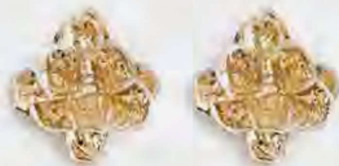
أقراط متدلية بتصميم زهور AED 99