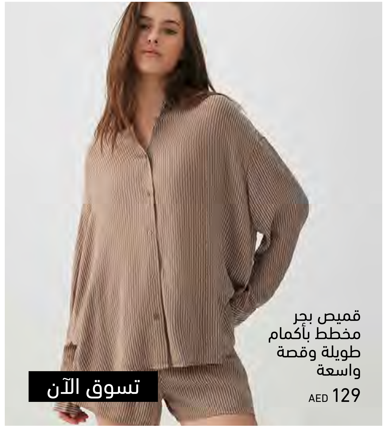
قميص بحر مخطط بأكمام طويلة وقصة واسعة AED 129