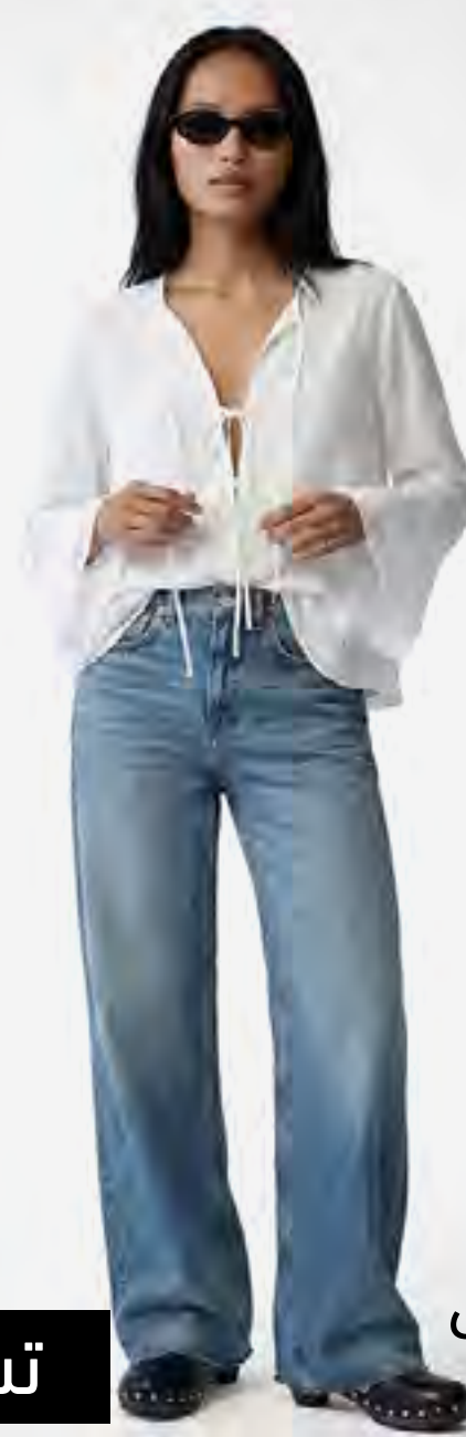
توب بأكمام واسعة وكشكش AED 149