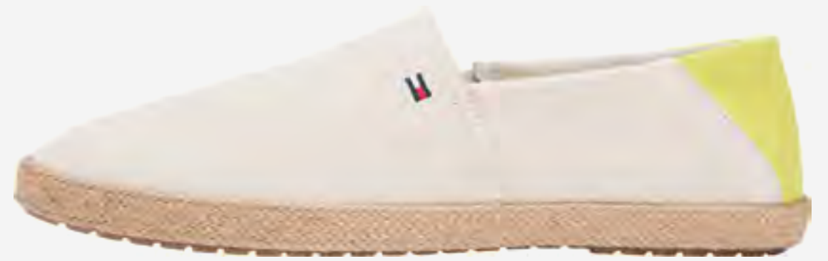
حذاء إسبادريل بمقدمة مستديرة AED 350