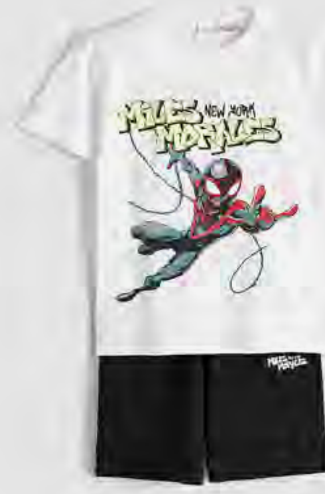
طقم ملابس كم قصير بطبعة سبايدرمان AED 59