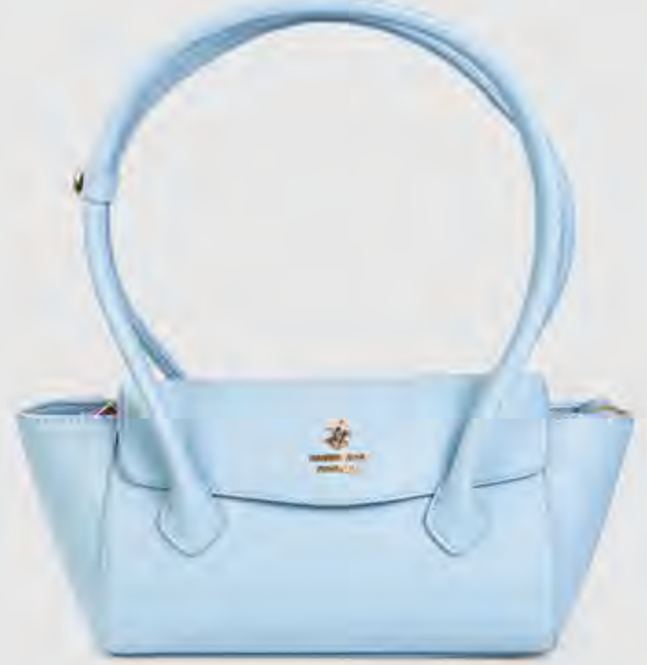
شنطة كتف بشعار وقفل كبس AED 349