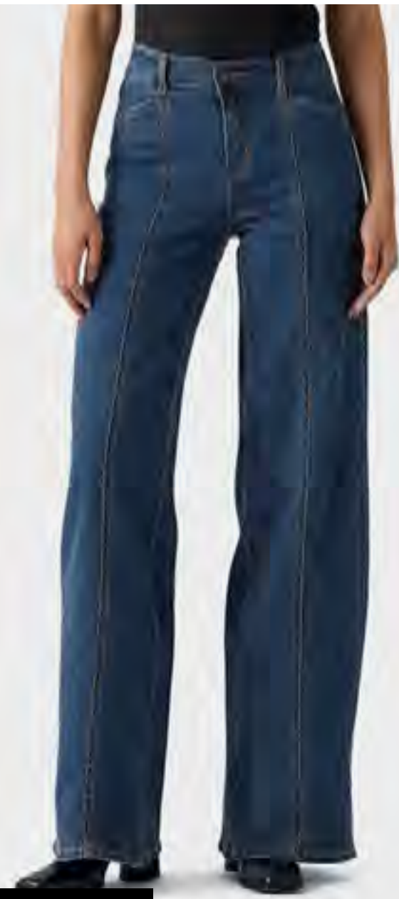
جينز واسع 318 AED 499