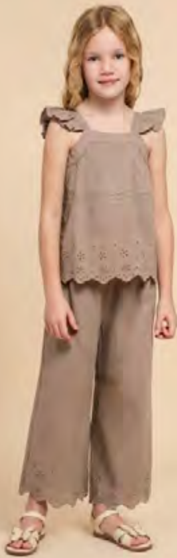
طقم بنطلون وتوب AED 65