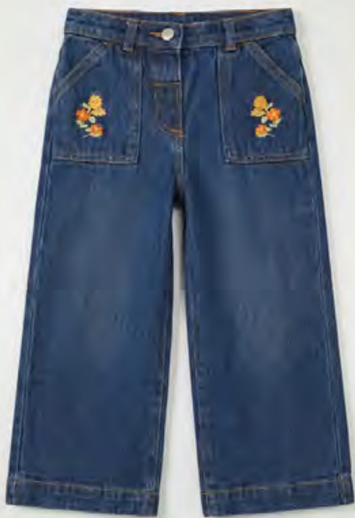
جينز عريض مطرز مع قفل زر AED 79