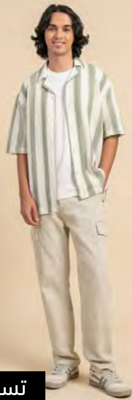
قميص مخطط كم قصير بقبة ريفر AED 60