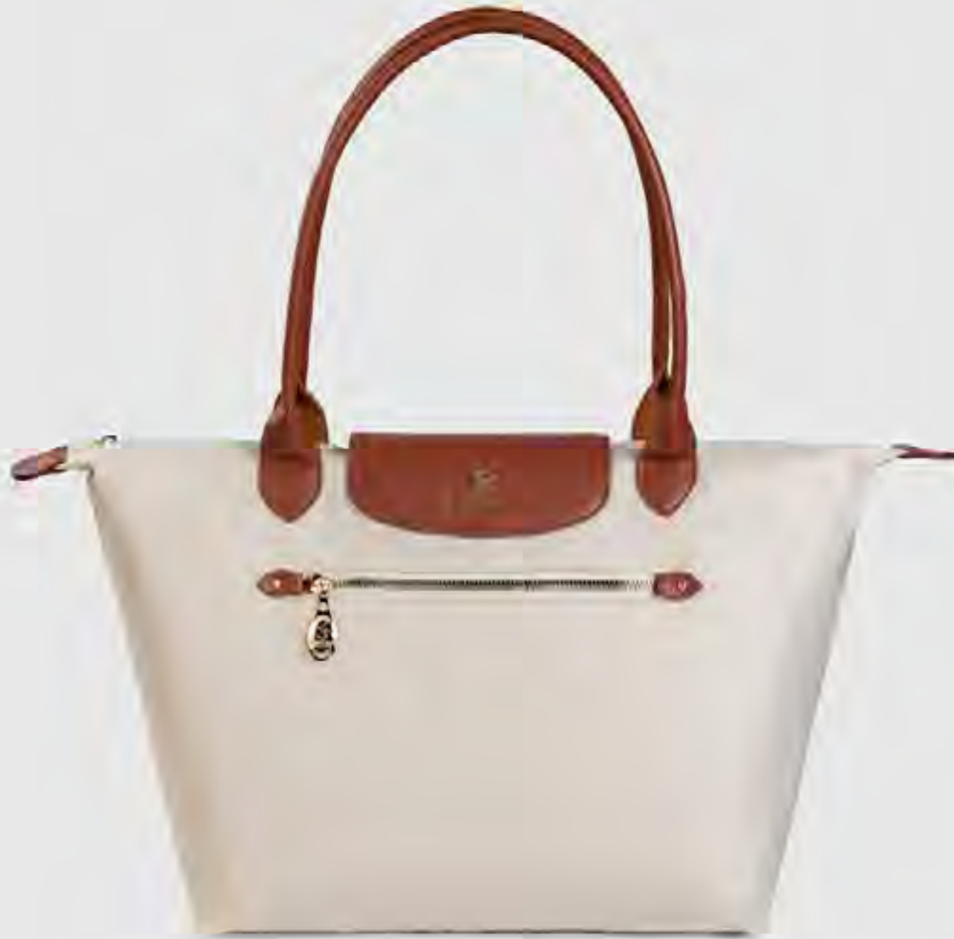
شنطة كتف بسحاب AED 349