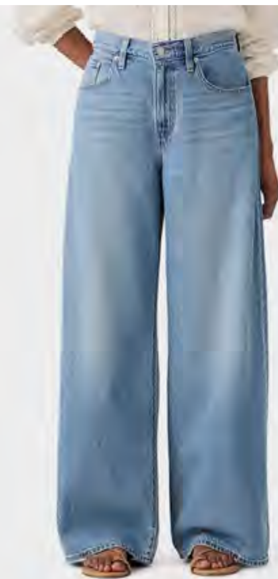
جينز مغسول بخصر عالٍ وقصة مستقيمة AED 399