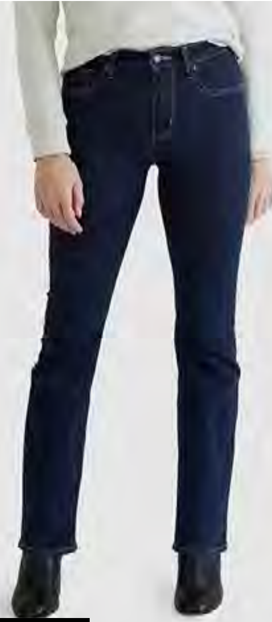
بنطال جينز ضيقة 725 بخصر عالي AED 349