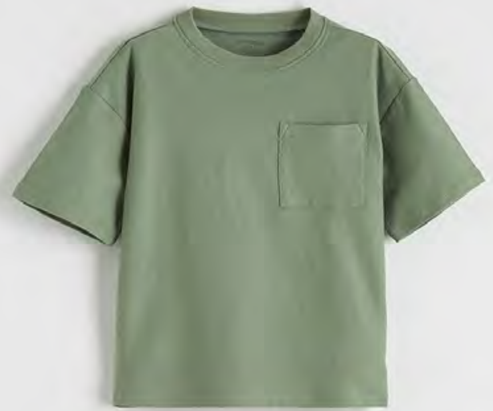
تيشيرت كم قصير بجيب أمامي AED 19