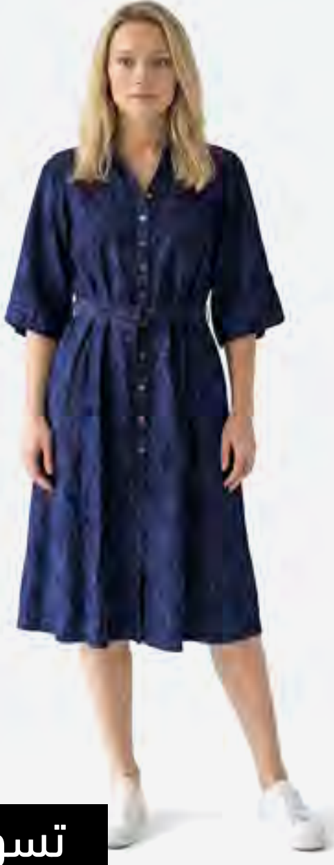
فستان قميص مطبوع بزهور وأكمام قصيرة AED 399