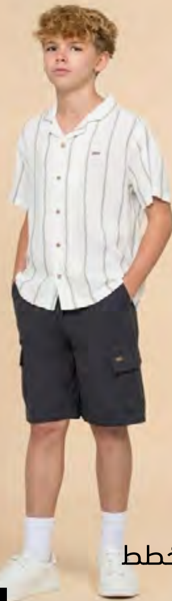
طقم قميص مخطط وشورت AED 75