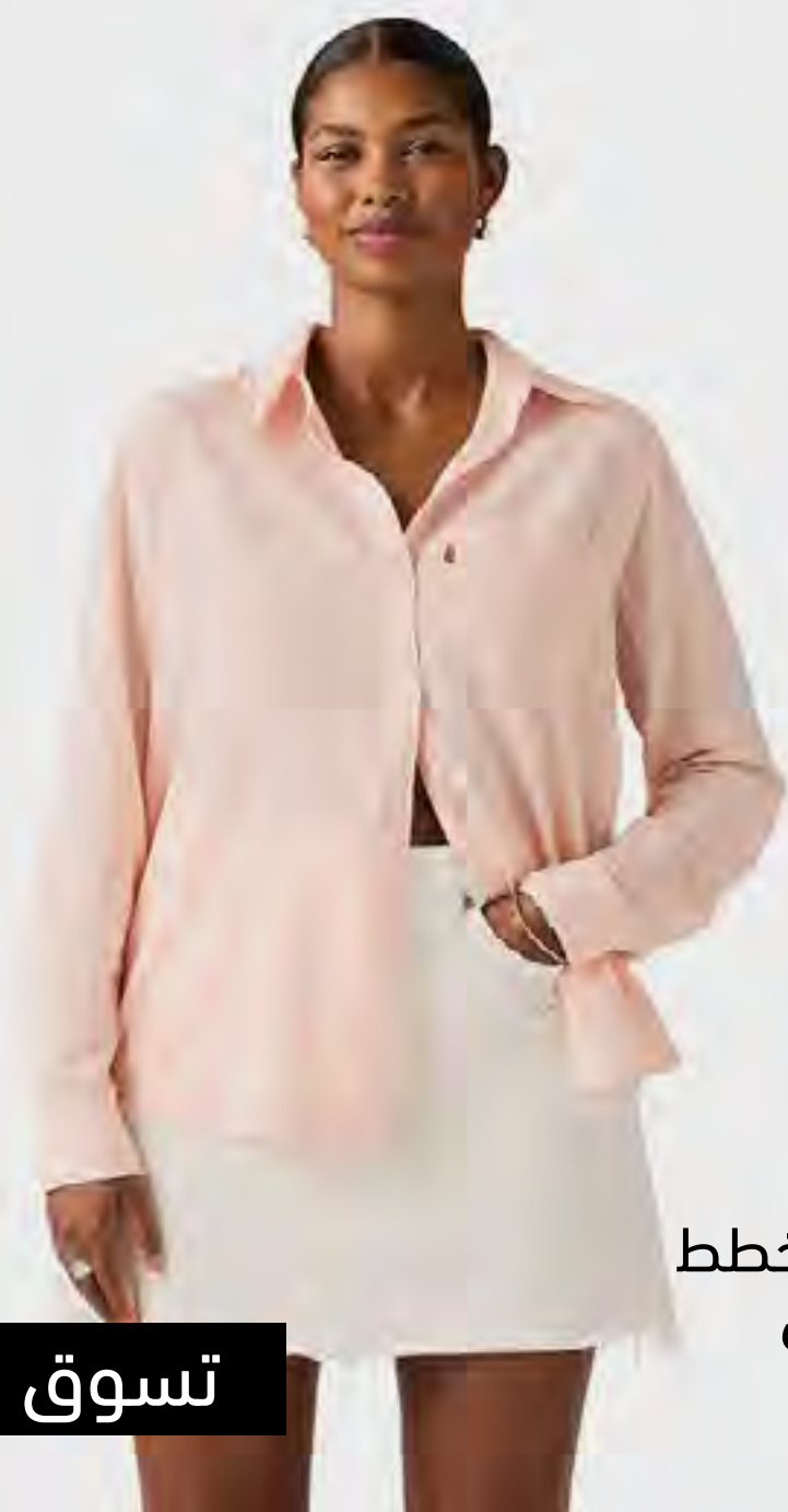
قميص مخطط بكم طويل AED 399