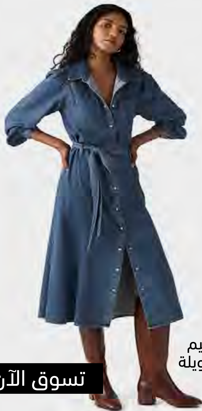
فستان ميدي دنيم جيرني بأكمام طويلة AED 499