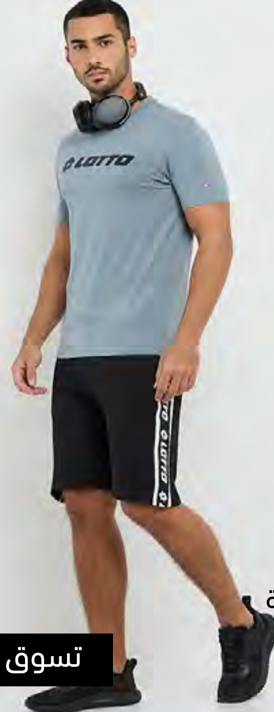
شورت لوتو بيرمودا بقصة قياسية AED 59