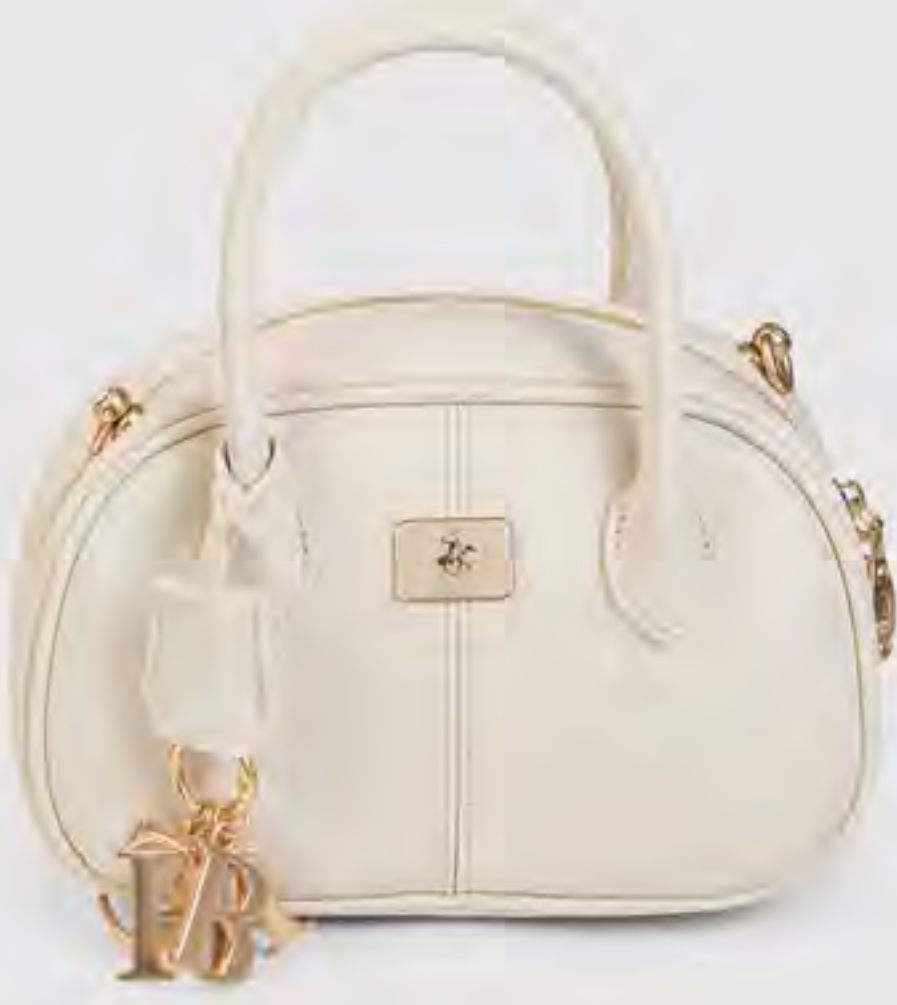
شنطة ساتشل بنقشة وتعليقة AED 349