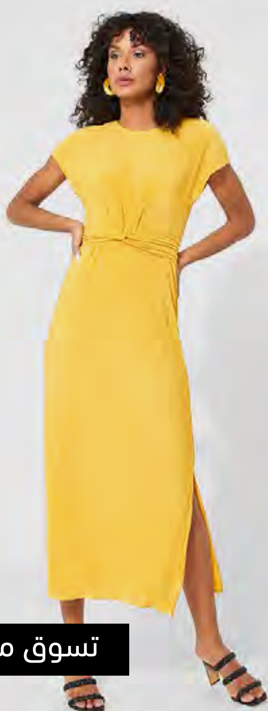
فستان مضع بخصر مزوموم AED 55