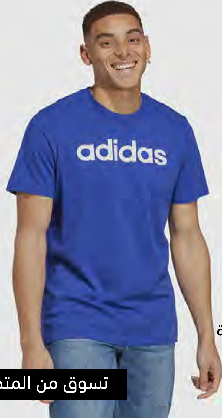
تيشيرت برقية دائرية مزينة بالشعار AED 109