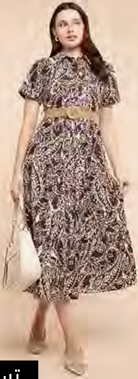
فستان قميص كم قصير بطبعة AED 75