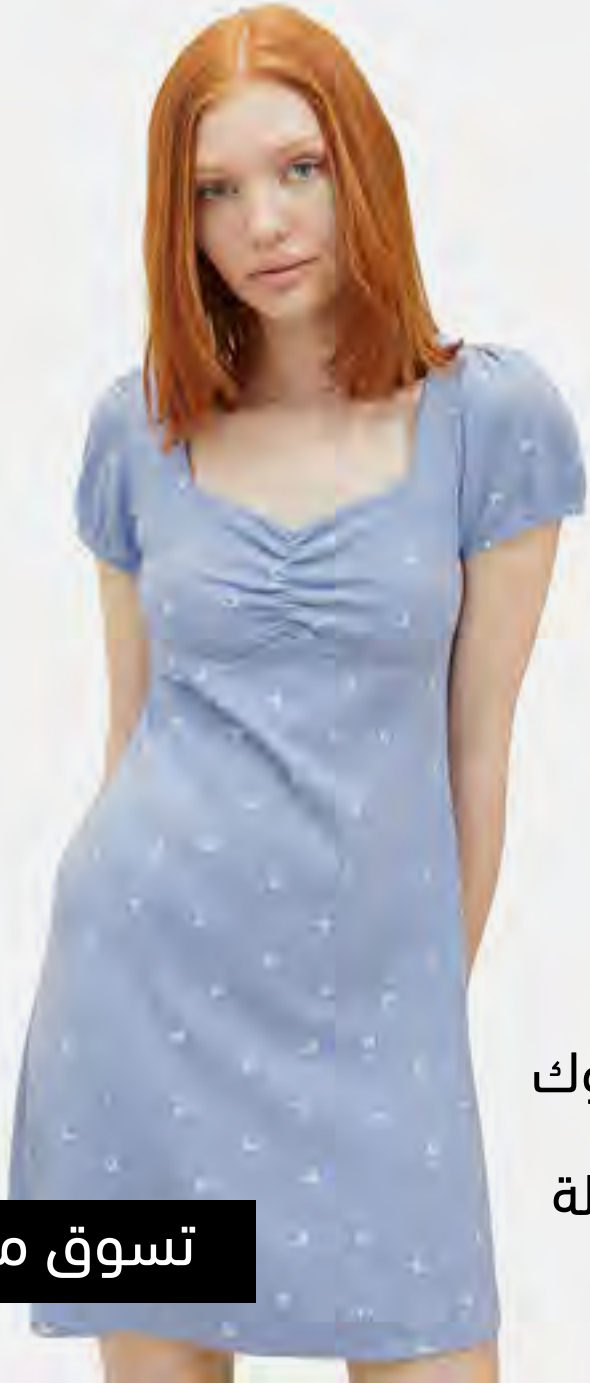
فستان محبوبك بقصة A وطبعة كاملة AED 115