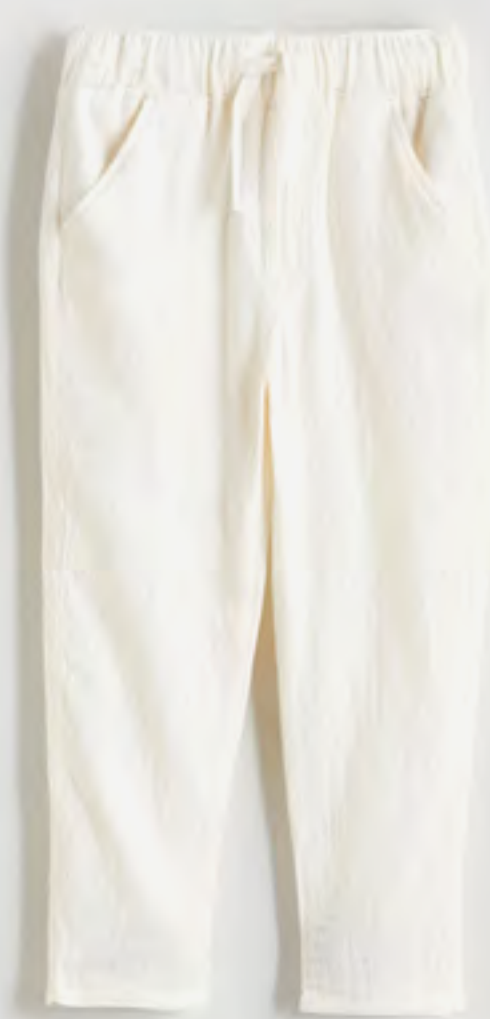
بنطلون سادة برباط على الخصر AED 44