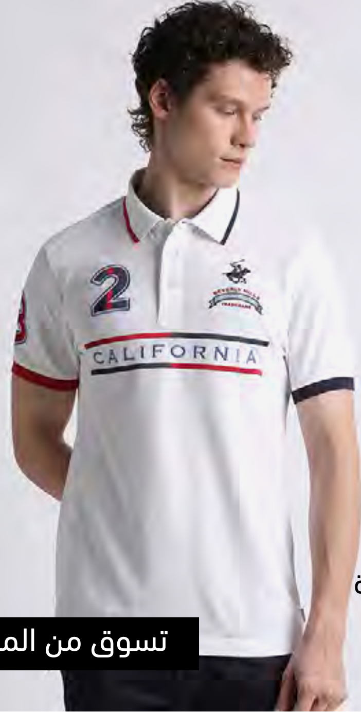
تيشيرت بولو بأكمام قصيرة وتطريز شعار AED 65