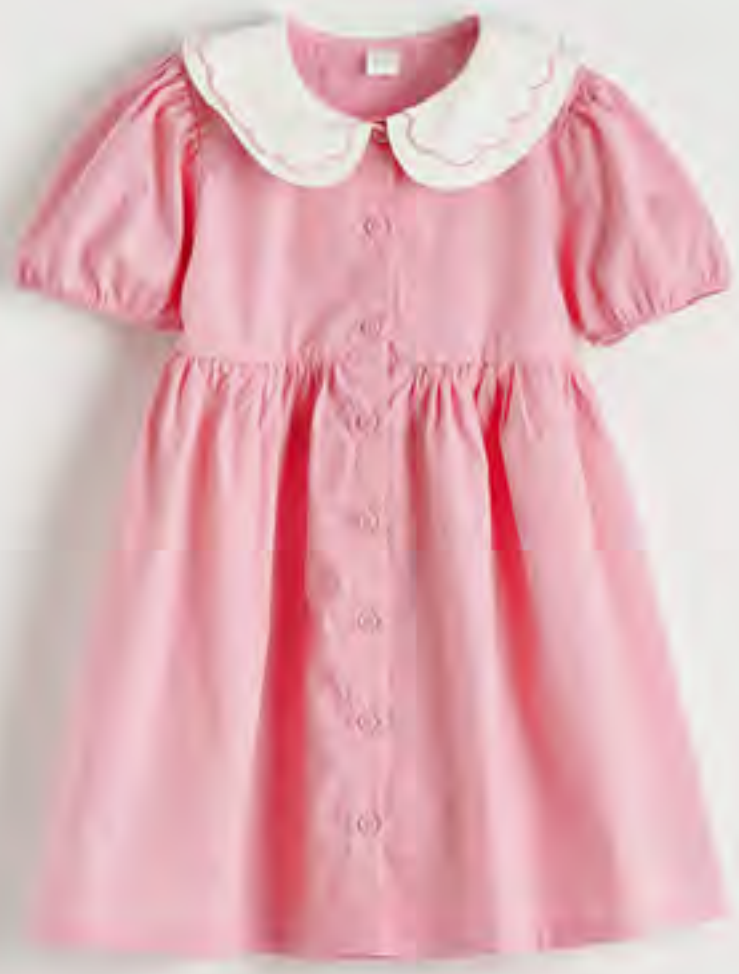
فستان بوبلين سادة بقبة بيتر بان AED 62