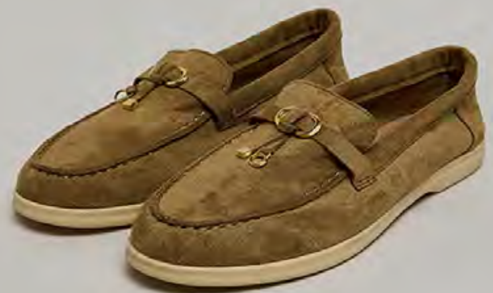
لوفر سادة AED 45