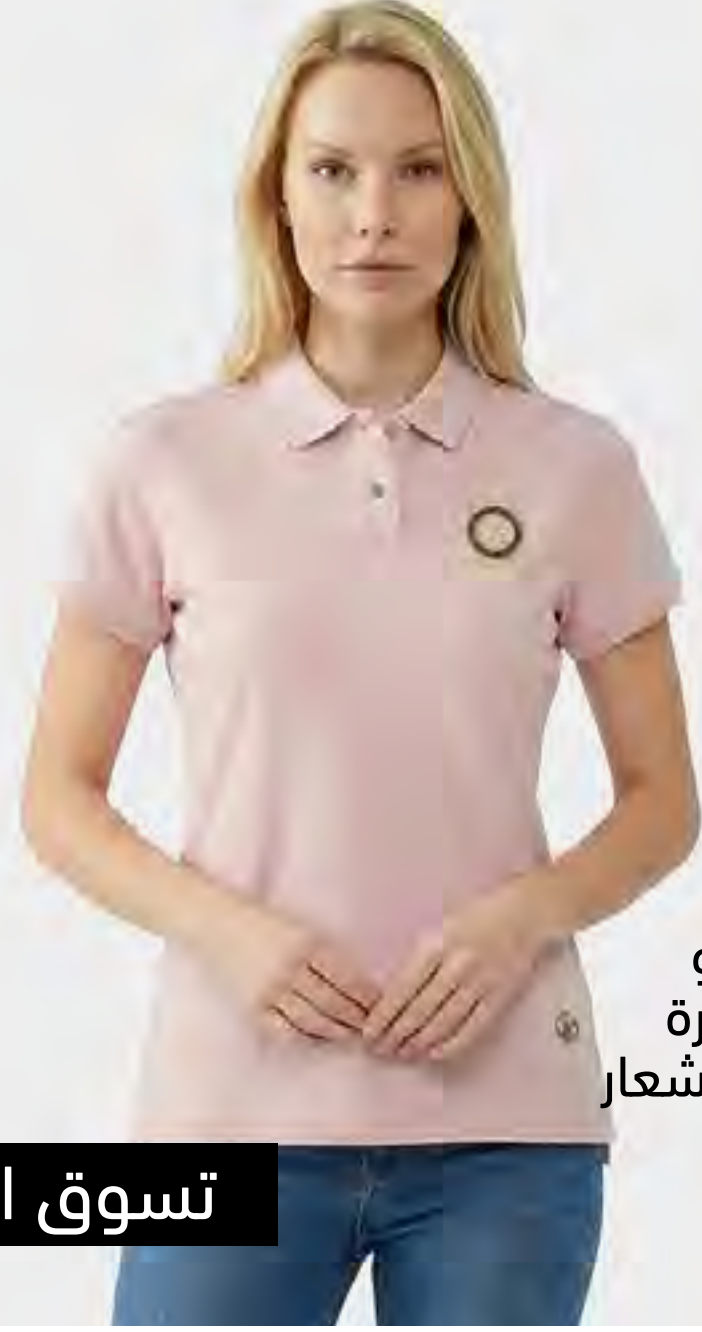
تيشيرت بولو بأكمام قصيرة مع تفاصيل شعار الماركة AED 279