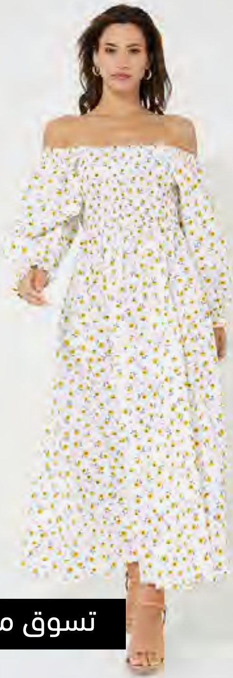
فستان ماكسي مطبوع بزهور وياقة مربعة AED 59