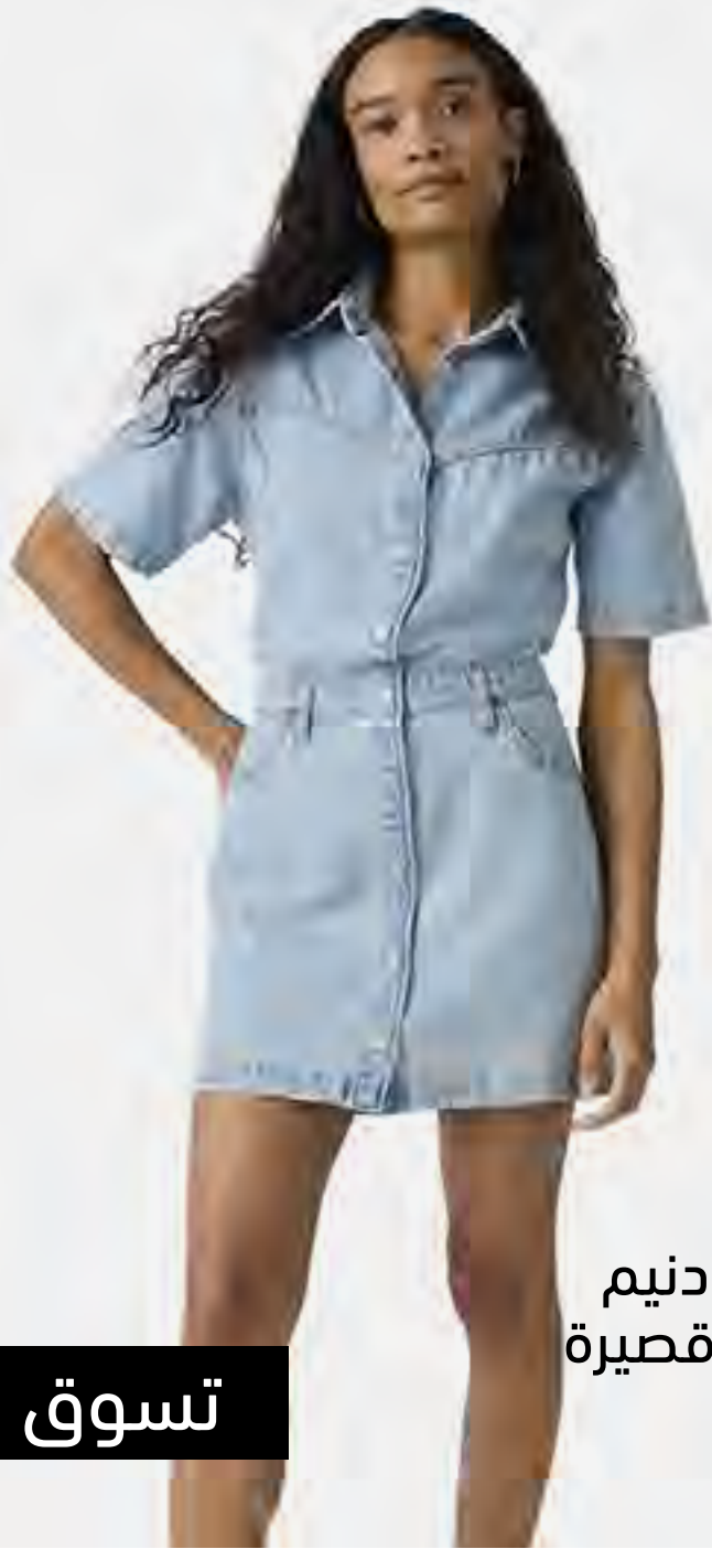
فستان ميدي دنيم لوغان بأكمام قصيرة AED 399