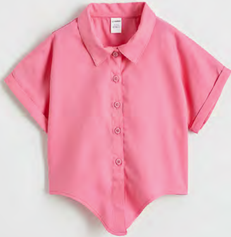
قميص سادة كم قصير AED 49